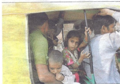
På turen oplevede læreren og eleven fra Herfølge Skole miserable forhold for mange indiere.